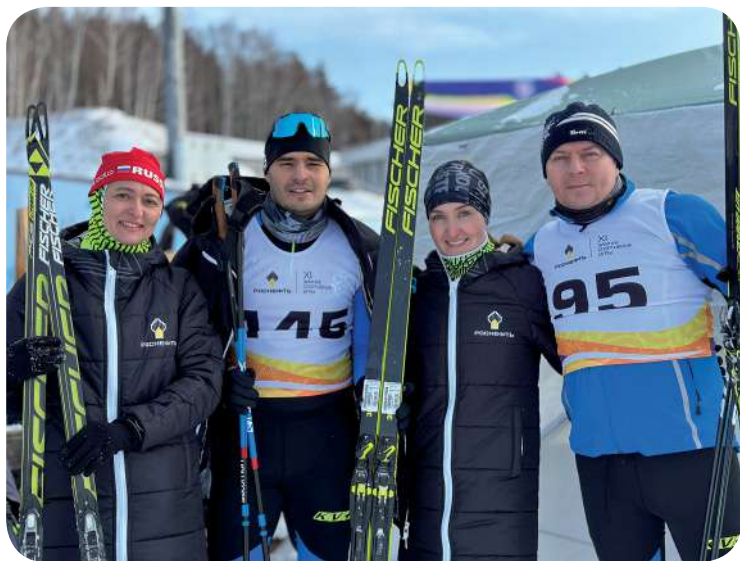
В команде тренируются не только мужчины, но и женщины

В команде тренируются не только мужчины, но и женщины.