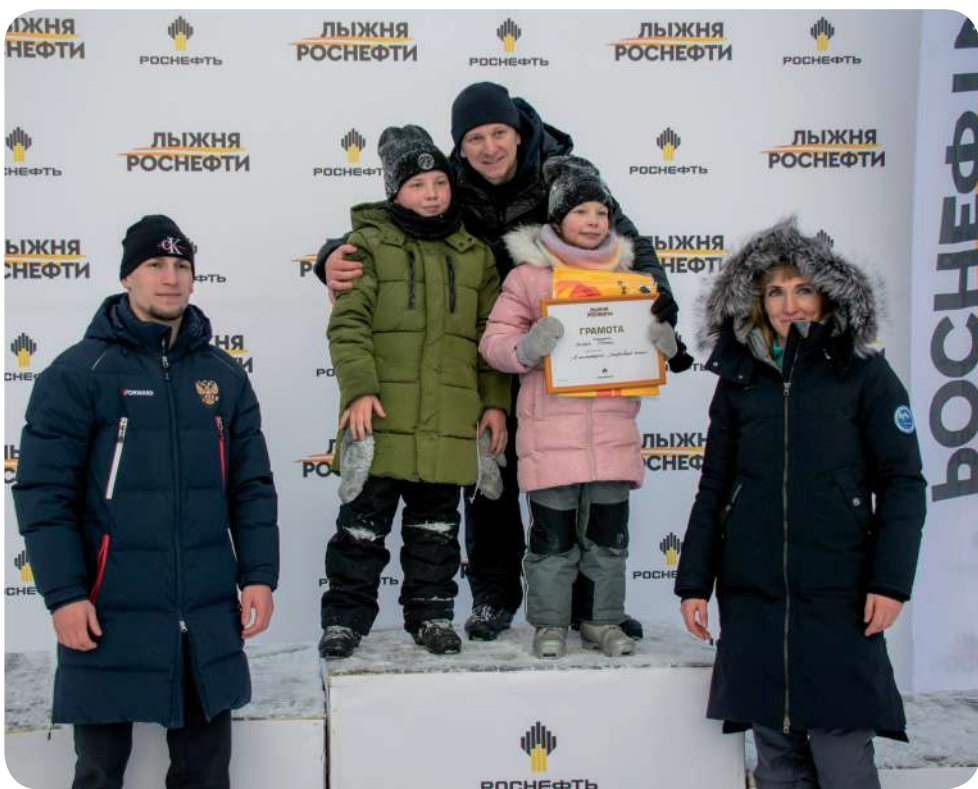
Участники получили невероятные эмоции и возможность активно провести время

«Роснефть» организовала массовые лыжные забеги в Ангарске, Красноярске, Тюмени и Нижневартовске. В столице Смотлора