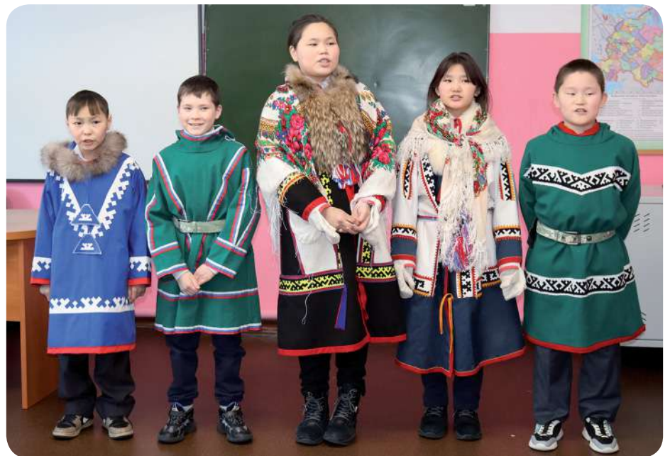
Учащиеся спели для гостей песни на ненецком языке

По итогам научного исследования был составлен сборник методических материалов «Тенденции кочевого образования», в который вошли развивающие программы на ненецком языке, уникальные практики и комплексы занятий по дошкольной подготовке воспитанников кочевых групп северных народов.