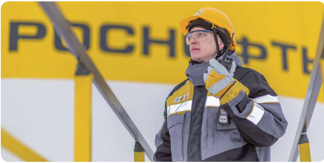
Предприятие ведет разработку месторождений на 40 лицензионных участках