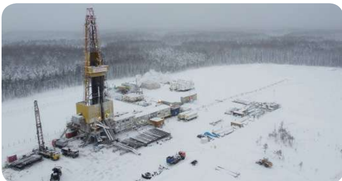
Ежегодно «РН-Юганскнефтегаз» реализует более 30 проектов испытаний новой техники и технологий

Ежегодно «РН-Юганскнефтегаз» реализует более 30 проектов испытаний новой техники и технологий, около 25 проектов по программе инженеринговых услуг, а также целевые проекты Компании в таких стратегических направлениях, как эффективная разработка месторождений.