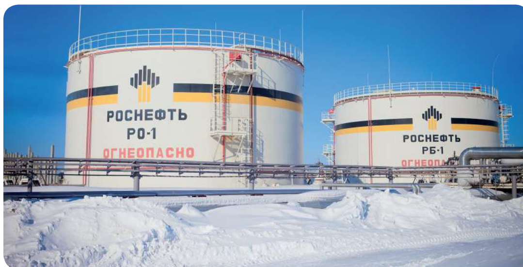
Компания проводит масштабную работу по сокращению эксплуатационных затрат

« Сотрудники Общества в 2023 году подали в отдел научно-технического развития и инноваций 27 рационализаторских предложений. 21 из них рекомендовано для внедрения в производственную цепочку. Экономический эффект от применения рационализаторских предложений в 2023 году составил более 300 млн рублей.