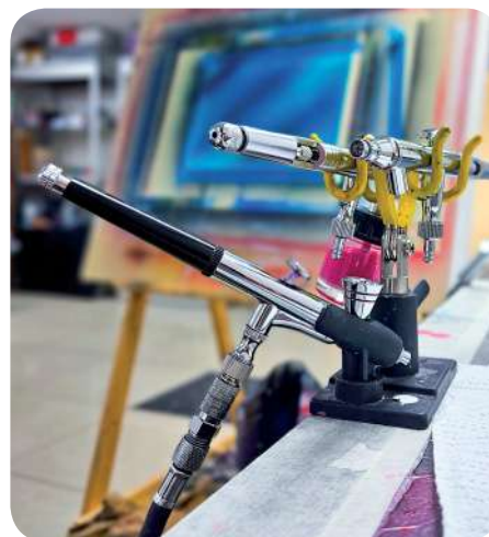
Занятия в студии-мастерской проводятся два раза в неделю

«Это аэрограф, – объясняет он. – Краска смешивается с воздухом, который подаётся под напором».