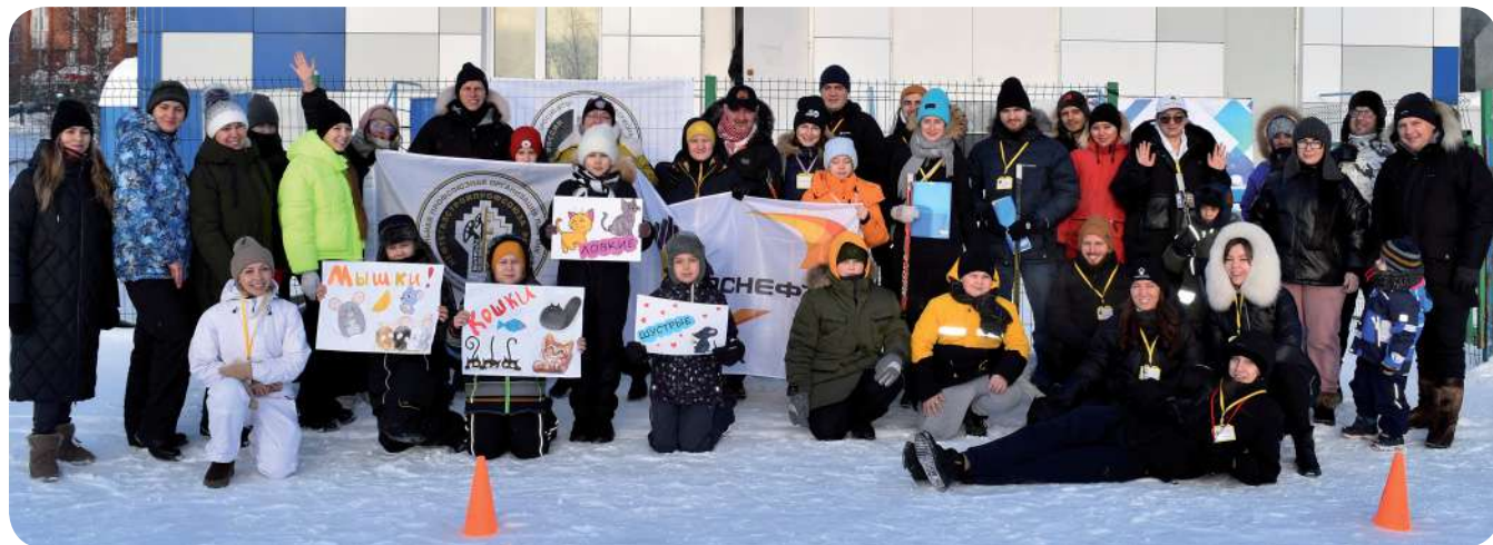
Соревнования приурочены к открытию Года семьи

В Новом Уренгое на лыжной базе «Контакт» состоялось весёлое спортивно-развлекательное мероприятие «Энергия Арктики». Организаторами и участниками стали сотрудники «РОСПАН ИНТЕРНЭШНЛ», а также члены их семей.