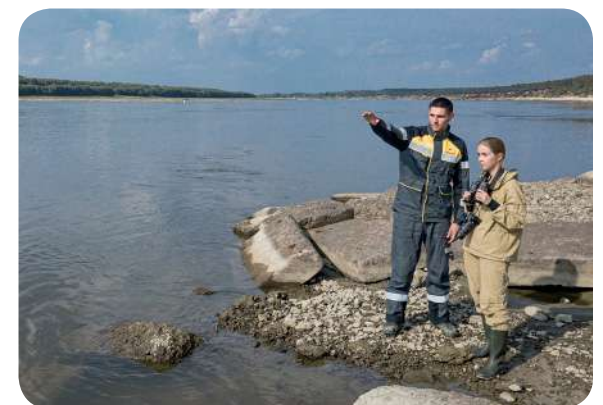
Создана единая база данных площадей озерных экосистем Тюменской области

Тюменские предприятия «Роснефти» планируют продолжить реализацию грантовых программ, т. к. сохранение окружающей среды для будущих поколений – неотъемлемая часть корпоративной культуры Компании.