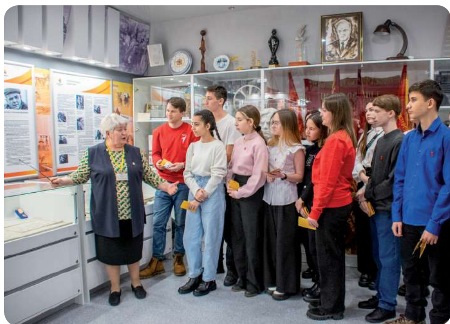
В корпоративном музее ребята увидели предметы 70-х годов прошлого века