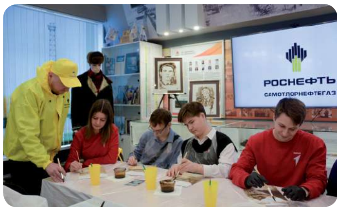
Встреча состоялась в рамках Всероссийского проекта «В гостях у учёного»

«Эта встреча состоялась в рамках Всероссийского проекта «В гостях у учёного».