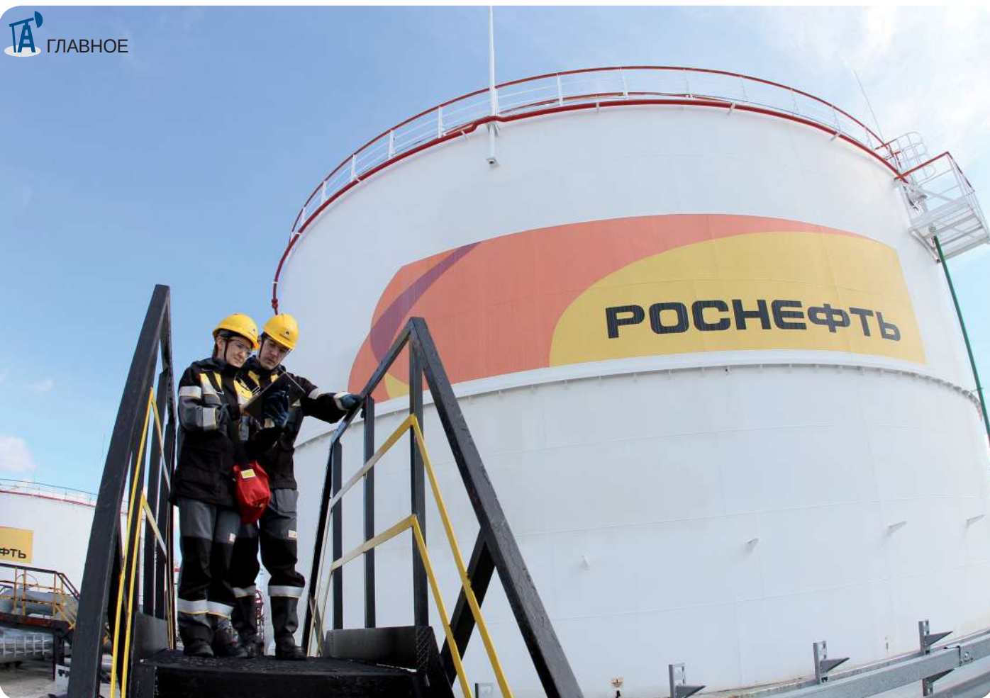
Развитие фундаментальной науки и технологического потенциала – важнейшие составляющие стратегии «Роснефти»