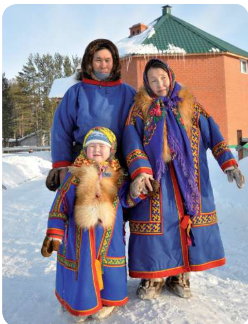
В тундре проживают около тысячи детей до семи лет

При поддержке «РН-Пурнефтегаза» на Ямале реализуется грантовая программа по развитию образовательных программ для детей коренных малочисленных народов Севера (КМНС), ведущих кочевой образ жизни.