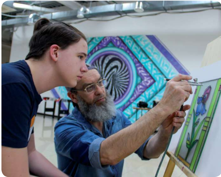
Студия открыта в рамках сотрудничества «Роснефти» и правительства Югры

Компания «Самотлорнефтегаз», которая входит в нефтегазодобывающий комплекс НК «Роснефть», открыла в Нижневартовске студию-мастерскую по обучению современным техникам живописи. Её презентовали на дне открытых дверей в арт-резиденции «Ядро».