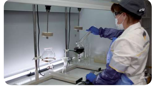
За смену лаборант может проводить более 35 различных видов анализов

«Многое, что мы делали раньше руками, сейчас автоматизировано. Замеры проводятся оборудованием, и показатели сразу вносятся в компьютер. Условия труда стали комфортными, находясь в операторной удобно контролировать производственный процесс. Я горжусь, что работаю в этом цеху. Коллектив у нас замечательный», – поделилась Людмила.